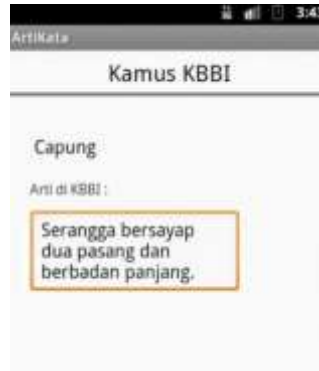
Gambar 6. Tampilan Dekompresi