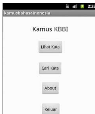
Gambar 3. Tampilan Menu Utama