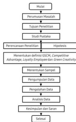
Gambar 1. Flowchart Metode Penelitian

Diharapkan hasil penelitian ini dapat memberikan kontribusi penting untuk memahami bagaimana pengaruh GSCM terhadap Competitive Advantage dapat dimediasi oleh loyalty employee dan green creativity pada Alfamart di Kabupaten Bekasi. Hasil penelitian ini diharapkan dapat memberikan masukan bagi perusahaan dalam meningkatkan kinerja dan daya saing melalui pengembangan GSCM, loyalitas karyawan, dan kreativitas yang ramah lingkungan.