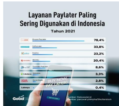
Gambar 1. Layanan Paylater

Seperti yang ditunjukkan dalam gambar 1 metode pembayaran nanti atau yang dikenal sebagai paylater adalah pilihan yang paling populer di antara konsumen. Dengan tingkat sebesar 78,4%, Shopee Paylater menjadi layanan yang paling banyak digunakan sepanjang tahun 2021. Paylater semakin diminati oleh berbagai kalangan karena menawarkan kenyamanan, kemudahan, dan kecepatan saat menggunakan kredit secara daring. Hal ini juga menjadi alternatif bagi masyarakat yang sedang mengalami kesulitan keuangan (Rahmawati & Mirati, 2022).