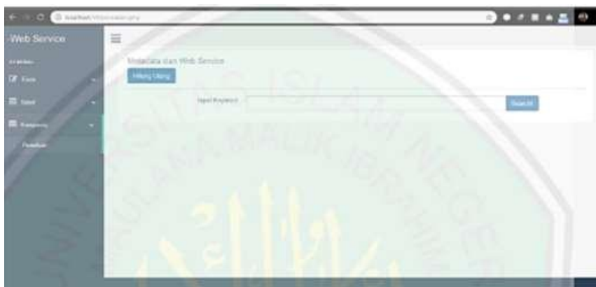
Gambar2. Tampilan Menu Utama

Pada halaman utama ini terdiri dari id, dan bantuan, ketika pengguna ingin menginputkan sebuah pertanyaan maka diharuskan untuk menginput id atau nama untuk sebuah tanda pengenalan kepada sistem chat bot ketika sudah melakukan penginputan identitas maka akan langsung masuk ke tampilan halaman percakapan, dan Tampilan halaman utama dapat dilihat pada gambar 2.