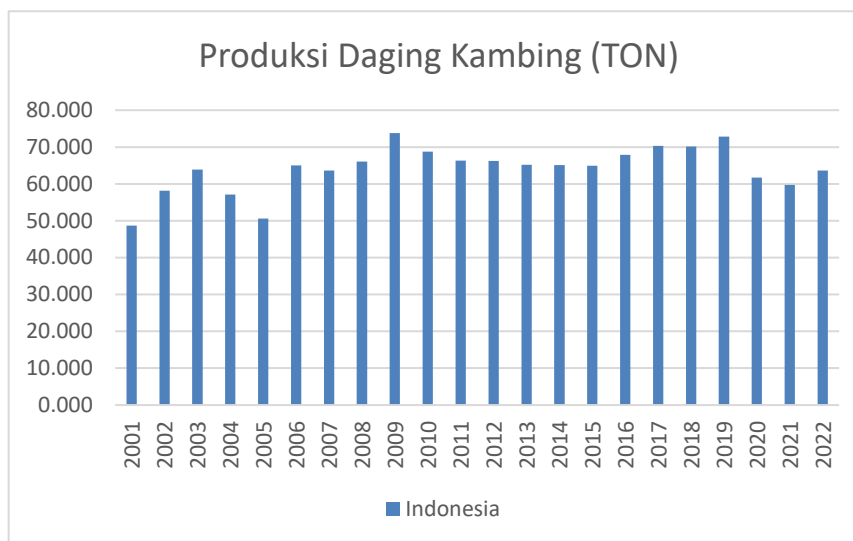
Gambar 1. Grafik Produksi Daging Kambing Di Indonesia

sumber protein yang sehat jika dikonsumsi dalam jumlah sedang[7]. Dapat dilihat dibawah ini jumlah produksi daging kambing dari tahun 2001-2022 yang didapat berdasarkan Badan Pusat Statistik Indonesia pada bagian peternakan.