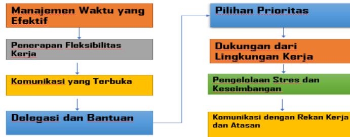
Gambar 2. Mekanisme Kerja Sebagai Ibu Rumah Tangga Dan Sebagai Karyawan BPR Bahteramas

pekerjaan dan kehidupan pribadi. Berdasarkan hasil temuan mekanisme kerja sebagai ibu rumah tangga adalah sebagai berikut: