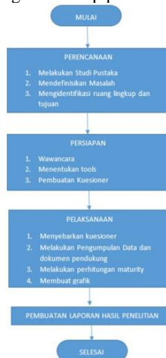
Gambar 2 . Tahapan Penelitian

Adapun metode penelitian digunakan agar fokus kegiatan tahap penelitian pada gambar di bawah ini: